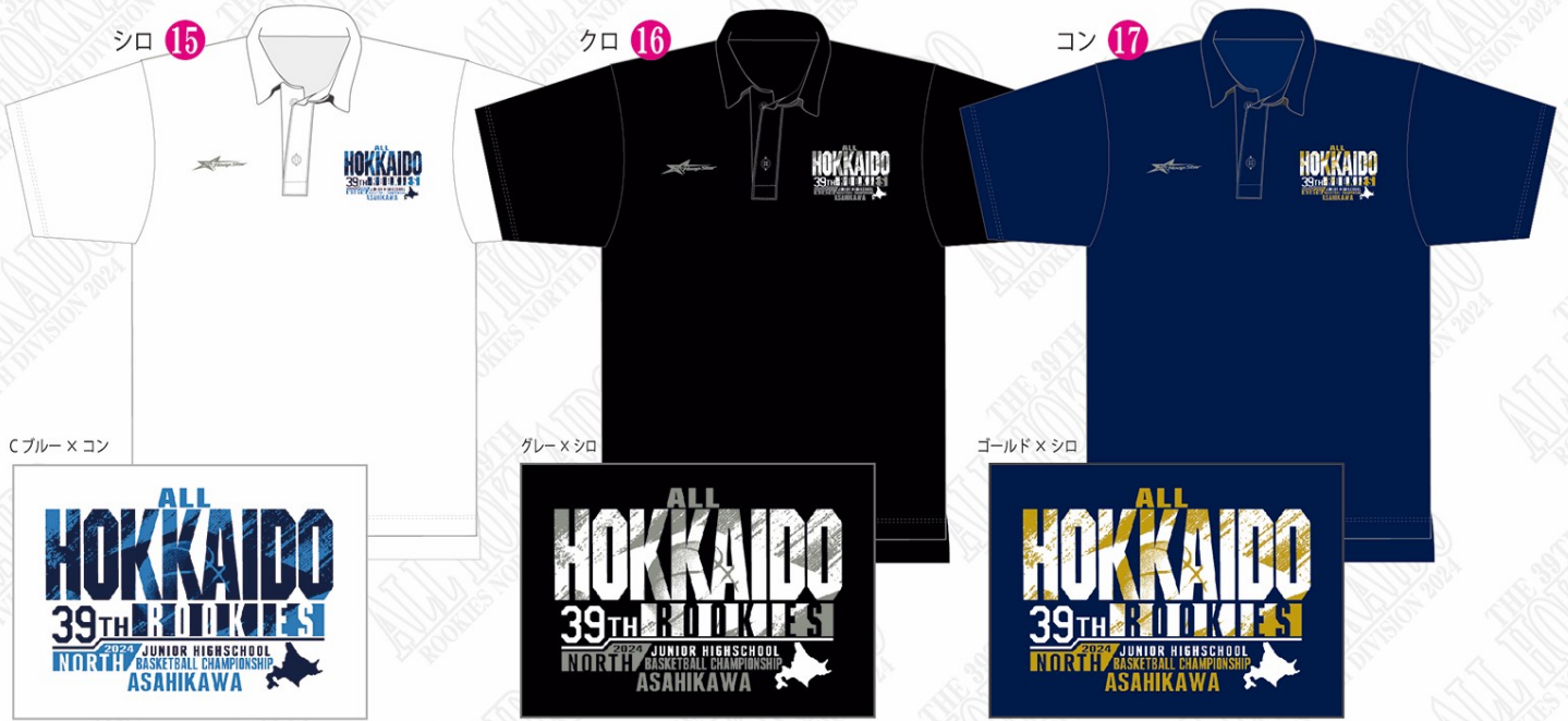
シロ 15 Cブルー×コン