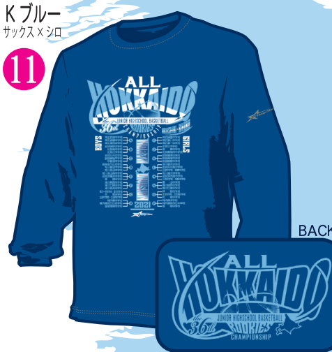
Kブルー サックス×シロ