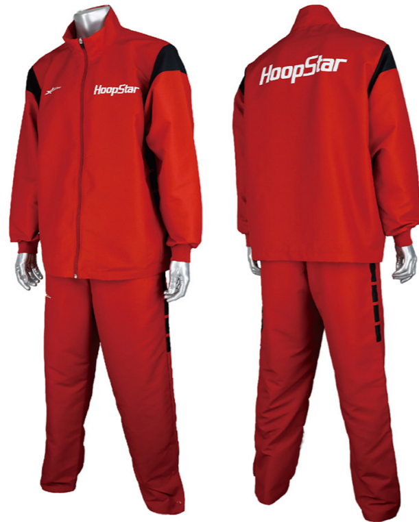
写真の使用カラーは アカ×クロ×シロ