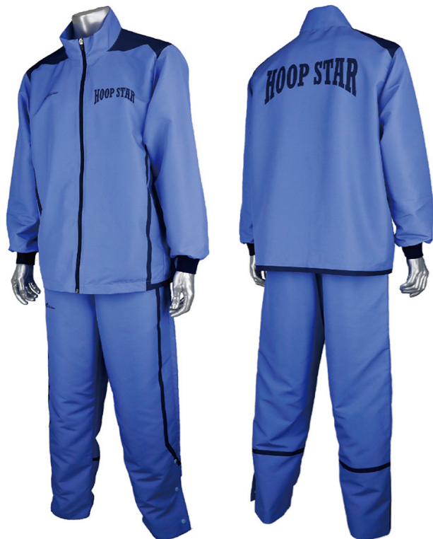
写真の使用カラーは コン×Cブルー